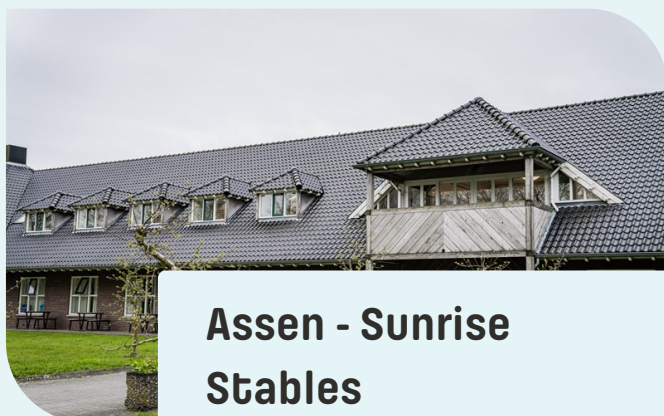
Assen - Sunrise Stables