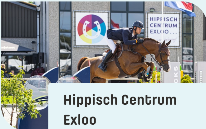
Hippisch Centrum Exloo